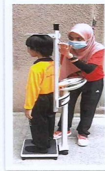
Ilustrasi 4 : Pengukuran Tinggi