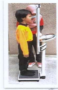
Ilustrasi 3 : Pengukuran Berat Badan