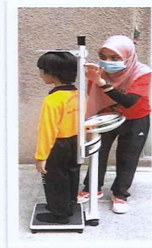
Ilustrasi 4 : Pengukuran Tinggi